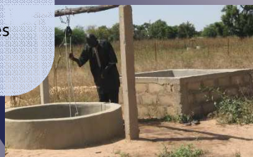
Puit & Réserve d'eau pour l'irrigation